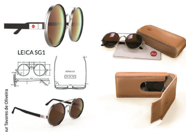
su: Tirozzi da Oliviera

Da corso attivato ogni anno a realtà stabile all'interno del Design Campus dell'ateneo: il 17 novembre sono state ufficialmente presentate le attività del nuovo laboratorio dedicato alla progettazione e alla ricerca nel settore dell'eyewear, che si propone come centro di riferimento per chi voglia concentrarsi sullo studio specifico delle montature